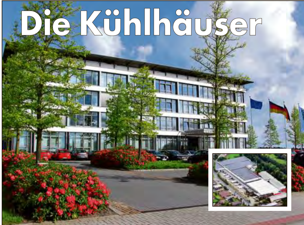
Schortenser Europazentrale und Schortenser Kühlhaus (kleines Foto)