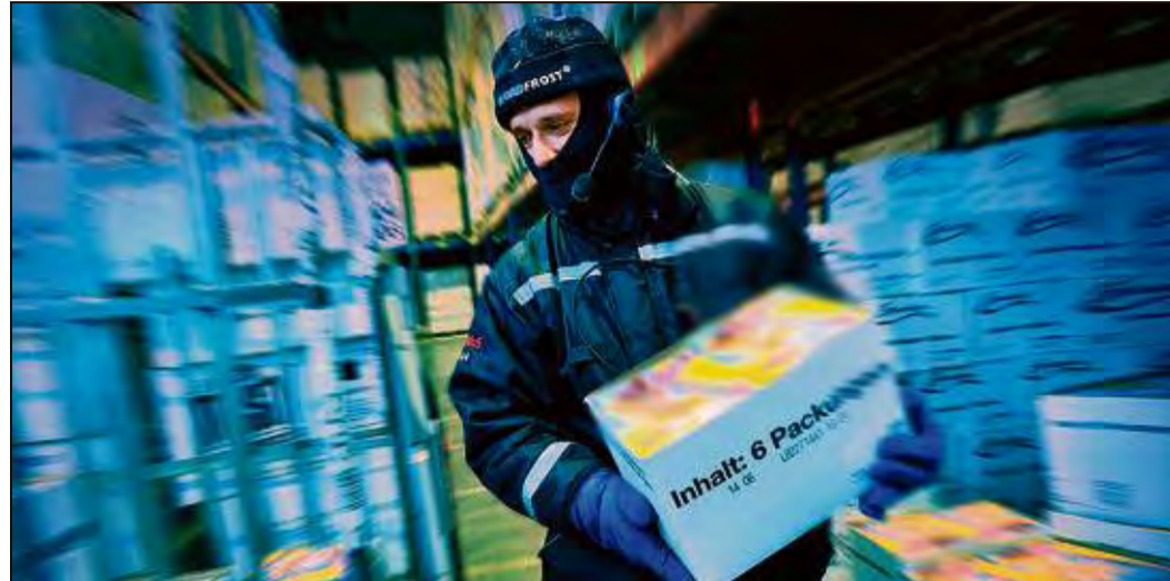
Cooler Aufstiegschancen bietet NORDFROST als Arbeitgeber.

Die Fachinformatiker der Fachrichtung Anwendungs-entwicklung entwickeln be-