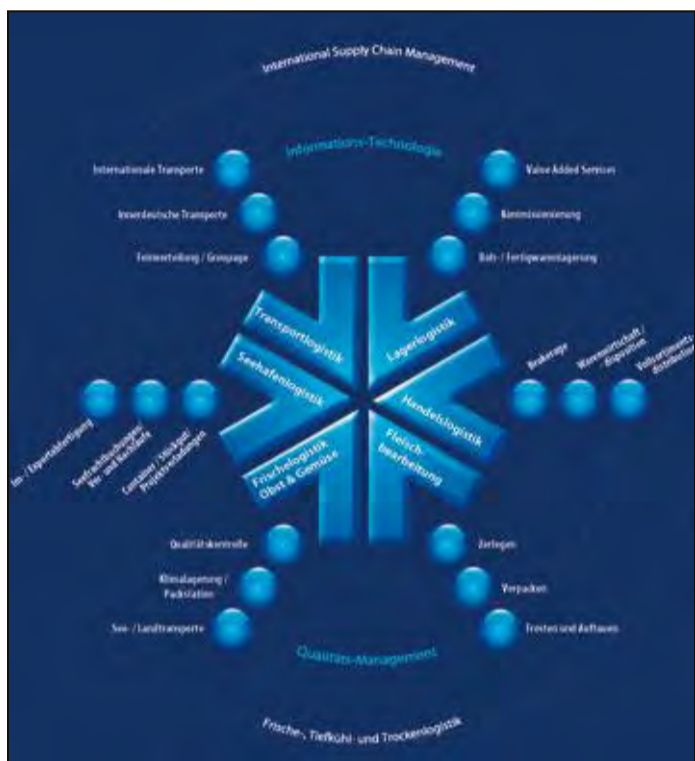
NORDFROST: Kompletter Service rund um Tiefkühlung und Distribution. GRAFIK: NORDFROST